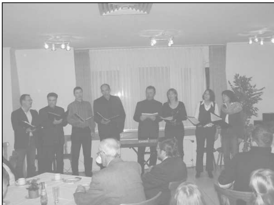
...begeisterten die Schachspieler: Salto Chorale