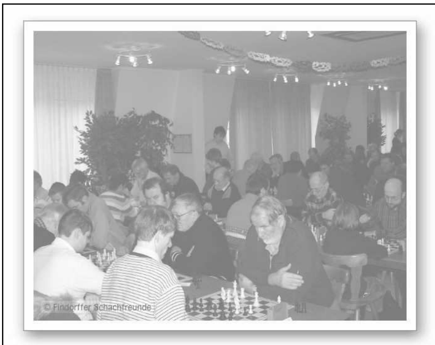
Rekord: Teilnehmerrekord 117 Spieler füllten zwei Säle.