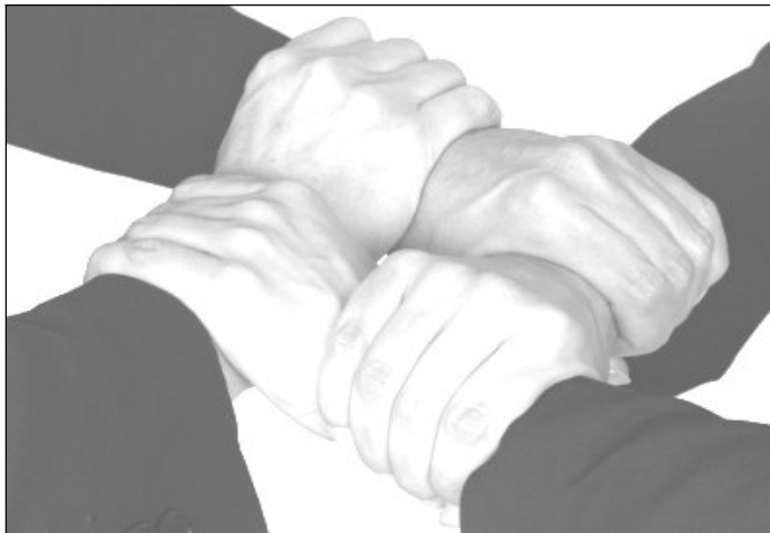
© Peter Kirchoff / PIXELIO - mit diesem Bild und dem Motto „Gemeinsam sind wir stark“ belegte der Fotograf Peter Kirchoff den 6. Platz beim Fotowettbewerb von Pixelio. ( www.pixelio.de )